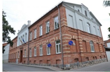
VIEŠBUČIŲ IR RESTORANŲ SEKTORINIS PRAKTINIO MOKYMO CENTRAS