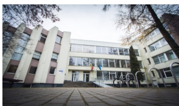
GIMNAZIJS SKYRIUS MAISTO TECHNOLOGIJŲ IR PREKYBOS SKYRIUS MAISTO PRAMONĖS (MĖSOS IR DUONOS KONDITERIJOS) SEKTORINIS PRAKTINIO MOKYMO CENTRAS